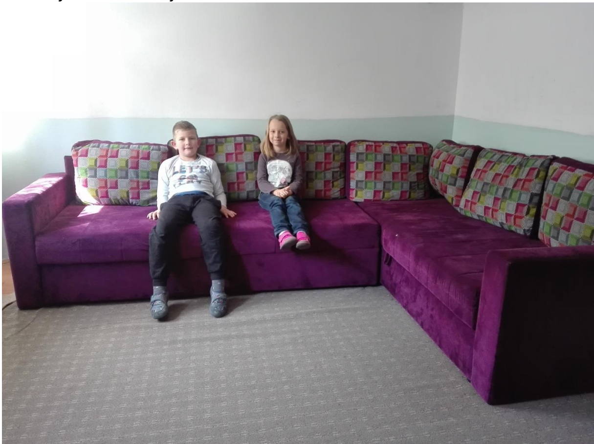
Prostorija za odmor