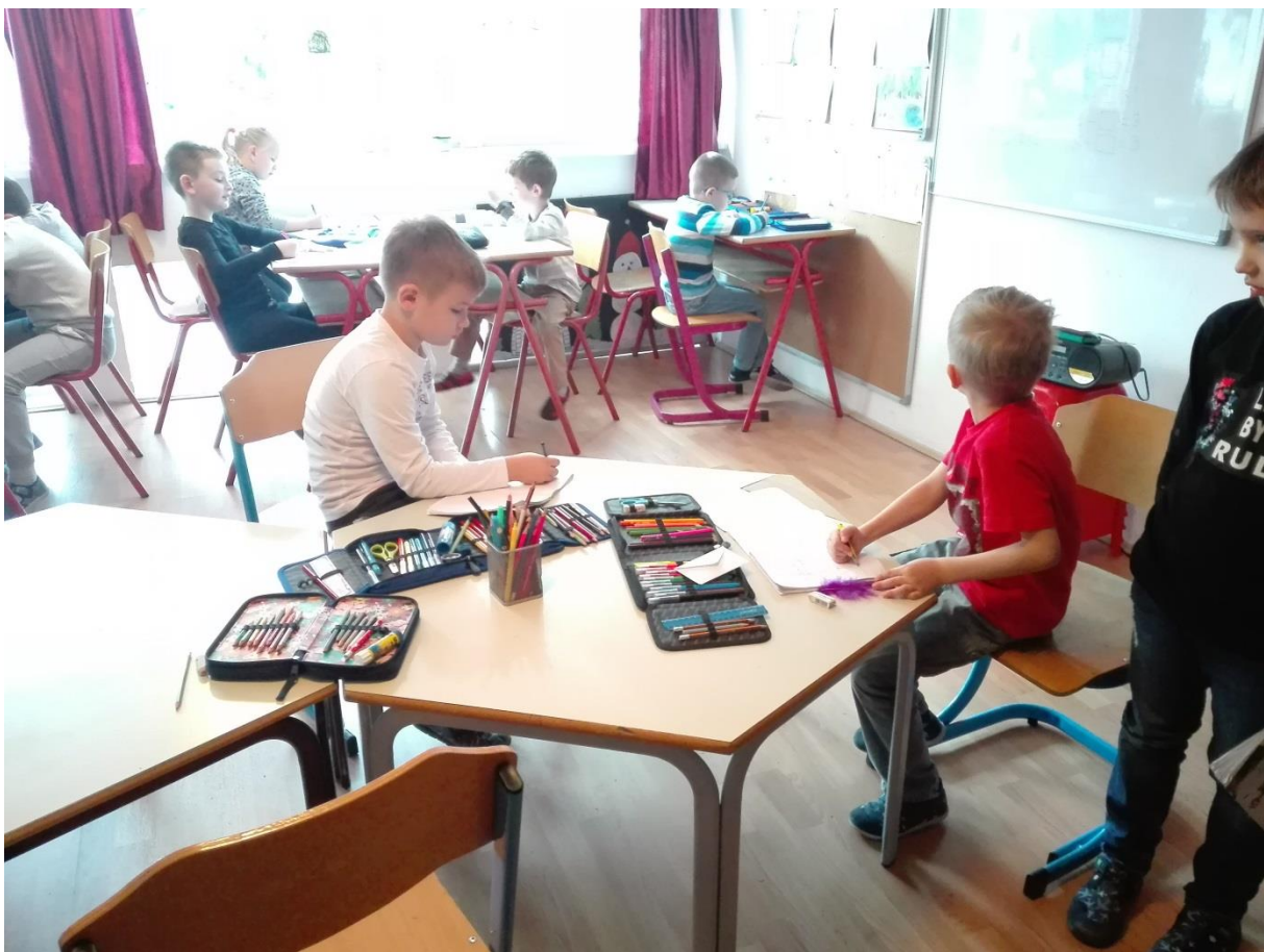
Prostorija za rad i učenje