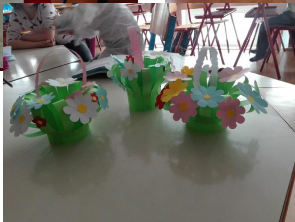
ruke naših učenika