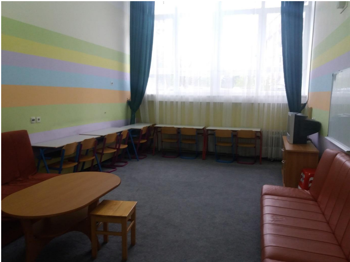
Prostorija za rad i učenje