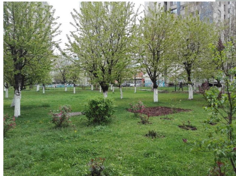
Prostor za igru i boravak na svježem zraku